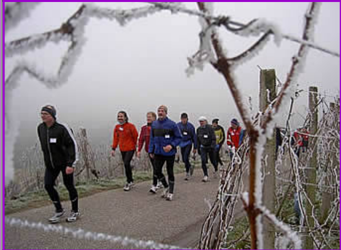
...eingehüllt in Nebel und Reif...

Am nächsten Morgen wurde mit einem Frühstück vom Büffet der noch dunkle Tag begonnen. Die letzten Lang-Läufer trudelten ein und jeder packte Tasche, Beutel oder Sack mit Ersatzkleidern und was jeder Einzelne sonst noch so braucht, wenn man vor hat, den ganzen Tag auf den Beinen zu sein. Das war ein Extra-Service, der besonders den Etappenläufern sehr zugute kam. Da Mahlberg SWR-Mitarbeiter ist, konnte er beim SWR zwei Fahrzeuge ausleihen, die das Verpflegungs- und Betreuungsteam für seinen Dienst bekam. Wir kamen reichlich zeitig in Offenburg an, so dass jeder noch genug Zeit hatte, für alles das, was erledigt werden musste.