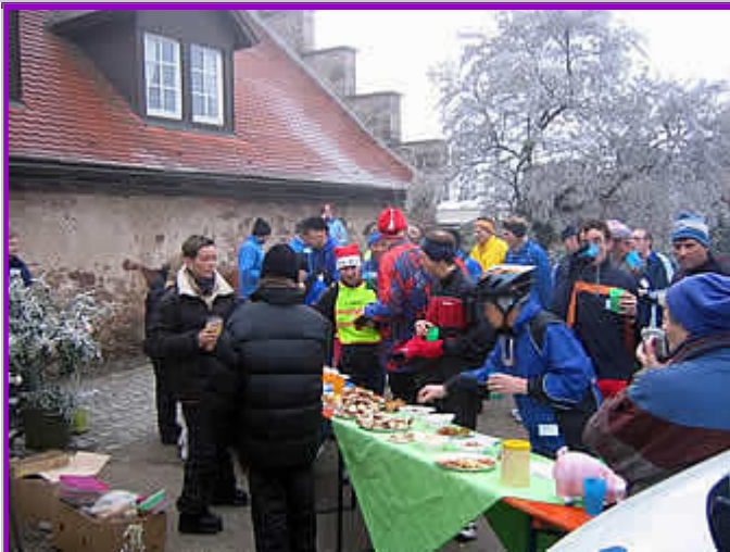
Das Buffet ist angerichtet (Burg Staufenberg)

Weinpfad entlang! Vorgabe: 7-8 min/km im Schnitt. Mittlerweile war es auch hell geworden, so dass wir das Tages-Wetter erkennen konnten. Sonne wäre zwar auch schön gewesen, aber das durch den Nebel verursachte Einheitswetter mit Temperaturen um den Gefrierpunkt bescherte uns später phantastische Landschaftsbilder.