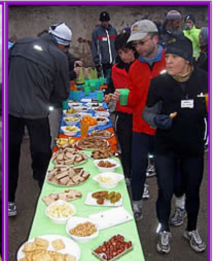
Mann, oh Mann, echt "verrückt"!

Schon ausgangs Offenburg, als wir die ersten Höhenmeter sammelten, dachte ich beim Anblick des ersten knackigen Anstiegs: Bei uns im Kraichgau sind die Weinberge aber niedriger! Die zwei ersten Hügel bringen's gleich mal auf 406 Höhenmeter, davon ca. 350 auf 6 km – hätten wir gut auch noch „Berglauf für Anfänger“ machen können.