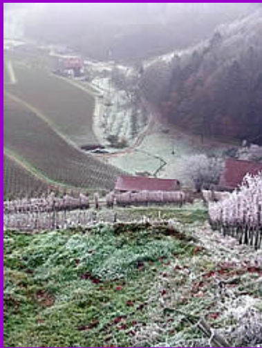
Blick zurück - das haben wir schon 'mal geschafft!