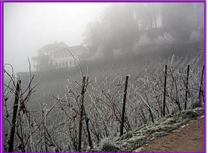
Winterliche Impressionen, das Schöne findet man überall