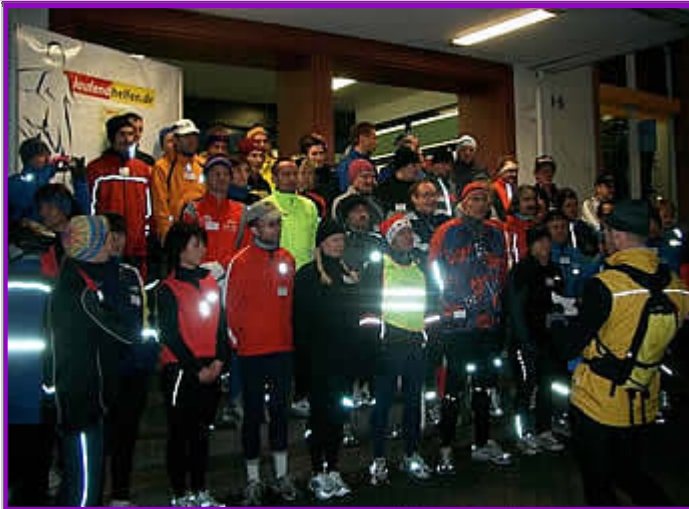
Antreten im Morgengrauen

Einnahmen der Veranstaltung erhält. Dieses Jahr wurde das Projekt „rettet Augenlicht“ der Christoffel-Blindenmission mit einem Reinerlös von rund 1000 Euro unterstützt.