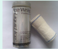
Liquid Ice™-Dose mit Kühlflüssigkeit und Kompressionsbandage